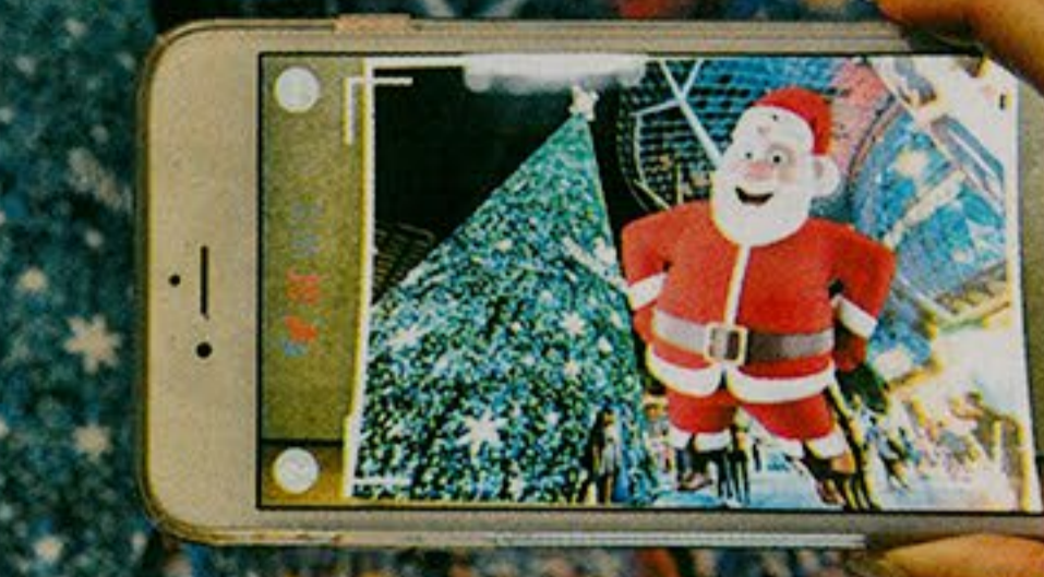
VR及AR技術目前多應用遊戲，但將來最火紅的未必會是遊戲行業。