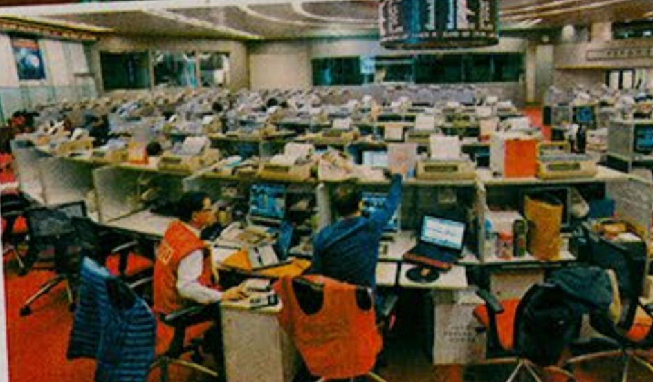
趙子翹認為，本港的上市條例仍未配合高科技產業發展。資料圖片